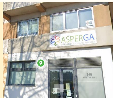
Sede de ASPERGA en A Coruña (Avda. de Oza, 240)

La idea es seguir creando más números, para ofrecer una revista con contenidos diversos e interés colectivo. La revista estará activa de manera trimestral.