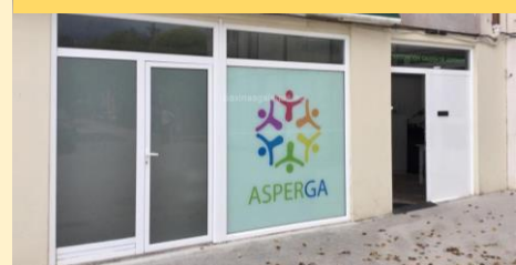
Sede de ASPERGA en Santiago (Avda. Castelao, 48)