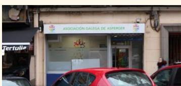
Mis inicios en ASPERGA, en la antigua sede de A Coruña